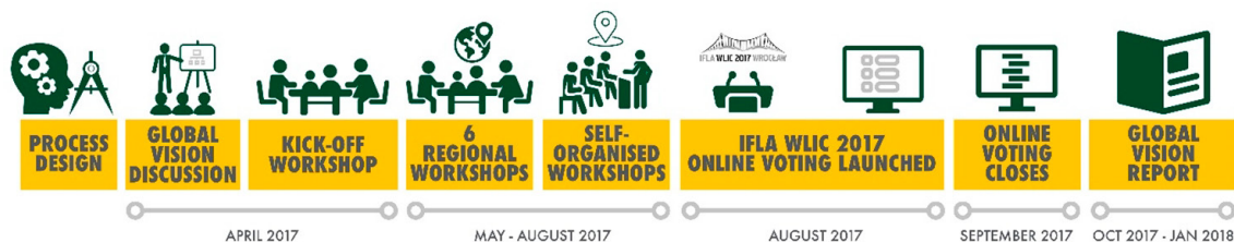
1. ábra Global Vision Roadmap I. 27