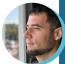
Csobán László Csorba Győző Könyvtár Pécs

Tíz-tizenöt év terepen töltött gyakorlattal a hátunk mögött azt mondhatjuk, hogy nem létezik mindenki számára ideális szolgáltatási időpont, éppen ezért minden évben igyekszünk úgy alakítani, hogy az a lehető legkedvezőbb legyen mindenki számára, ide beleértjük a személyzetet is. Kialakult törzsolvasói bázisaink vannak, melyekhez csatlakoznak időnként új érdeklődők, visszatérnek régi használók, s természetesen vannak lemorzsolódások is. Az egyéni sajátosságokhoz úgy lehetséges igazán jól csatlakozni, hogy felvettük egy-egy település működésének "ritmusát". Ehhez szükséges volt kideríteni például, hogy kik vonhatók be segítségként a szolgáltatás működtetésébe, ami a polgármestertől egy lelkes közfoglalkoztatottnak át egy helyi segítő szervezetig (pl. Magyar Máltai Szeretetszolgálat) is elnyúlhat. Nem kedveljük a fluktuációt, de sűrűn találkozunk a jelenséggel. Meg kell említenünk azokat az apró településeket is, ahol semmilyen platformon nem jutottunk komolyabb eredményre; van pár ilyen előregedő, elnéptelenedő baranyai település is.