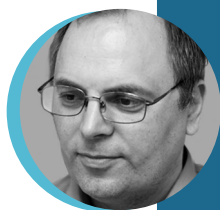
Dr. Babosi László Móricz Zsigmond Megyei és Városi Könyvtár Nyíregyháza

Könyvtárbuszunk, a Guruló Könyvtár, 2014-ben indult útjára, munkaideje keddtől szombatig tart. Egy könyvtáros és egy sofőr dolgozik rajta, akik a sajátos településszerkezetű nyíregyházi bokortanyák (5 tanya) és a Fehérgyarmati térség 30 könyvtár nélküli falvaiba látogatnak el. A településeken a bibliobusz érkezése a lakosoknak mindig esemény is, találkozási alkalom és kapcsolódási pont a külvilághoz. Tapasztalataink szerint a személyes jelenlét kiemelten fontos a szolgáltatás sikerességében. A rendszeresen visszatérő könyvtáros és a megszokott időpontok bizalmi kapcsolatot alakítanak ki az olvasókkal. Sok esetben nemcsak kölcsönzés történik, hanem beszélgetések, információkérések, segítségnyújtás is. A könyvtárbusz ezért egyszerre lát el kulturális, közösségi és szociális funkciókat, így a busz a kulturális alapellátás egyik meghatározó szereplője. A települések önálló megállóhellyel rendelkeznek, ahová menetrend szerint kéthetente másfél órára, ugyanabban az időpontban érkezik meg a Guruló Könyvtár. A 35 megállón belül 6 iskolai település található, ezeken mindig két órát áll a busz, pótolva itt nemcsak a köz-, hanem az iskolai könyvtárakat is. A tanulók rendszerint szervezett formában a pedagógusokkal együtt látogatják meg a bibliobuszt. Könyvtáros kollégánk tematikus könyvtárhasználati órákat szokott tartani. A gyerekek számára a böngészés, az olvasás és a kölcsönzés sokkal izgalmasabb, mint egy hagyományos könyvtárban, ezért szívesen látogatnak meg minket.