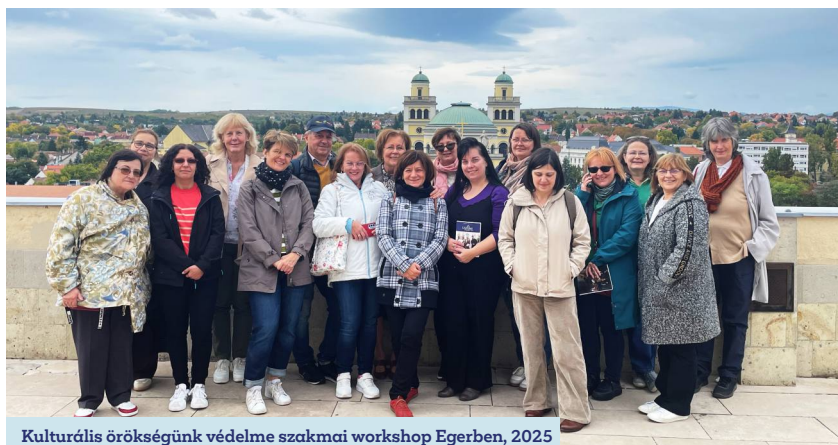
Kulturális örökségünk védelme szakmai workshop Egerben, 2025