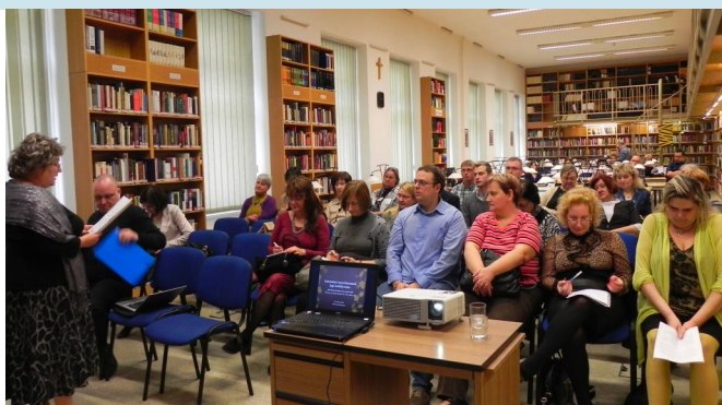
„Open Access és a jogtudomány” konferencia PPKE JÁK, 2015