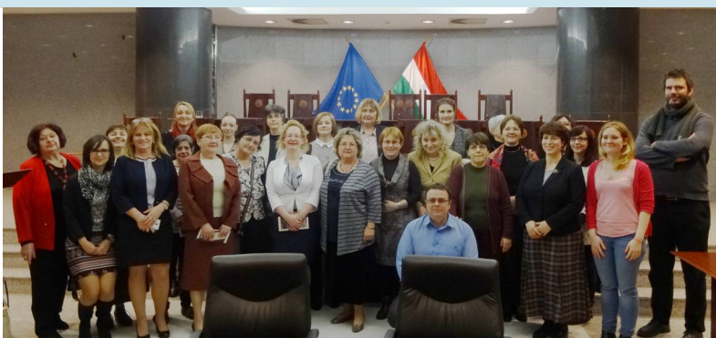
MKE Jogi Szekció megalakulásának 5. évfordulója és taggyűlése az Alkotmánybíróságon, 2016