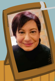
Istók Anna Gödöllői Városi Könyvtár és Információs Központ