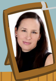
Schmoltz Margit Helischer József Városi Könyvtár, Esztergom