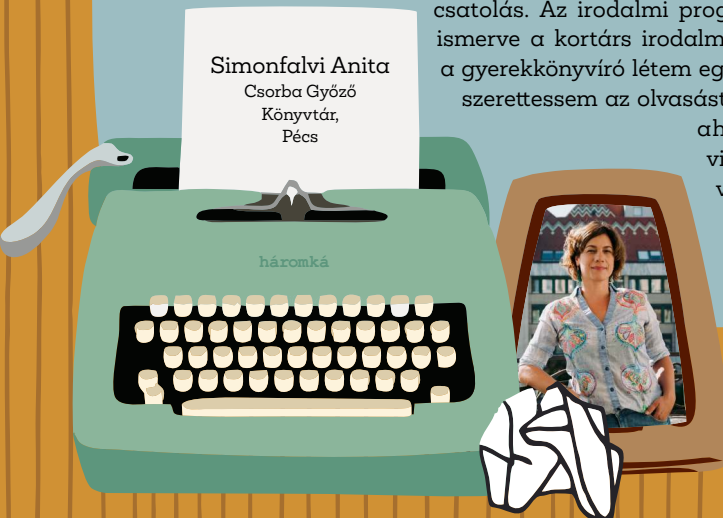
Simonfalvi Anita Csorba Győző Könyvtár, Pécs

az irodalom képes megváltoztatni, jobbá tenni a világot.