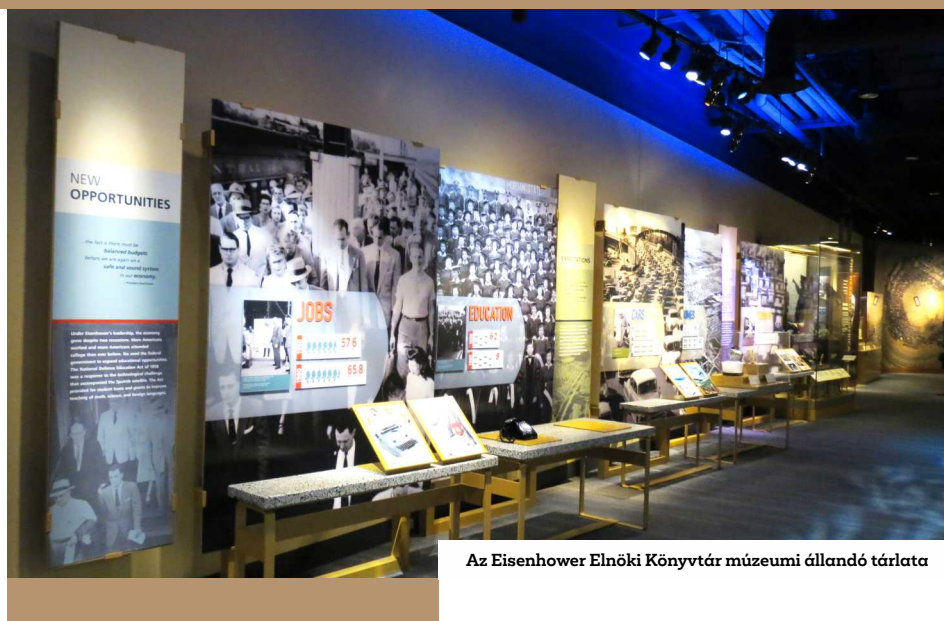
Az Eisenhower Elnöki Könyvtár múzeumi állandó tárlata