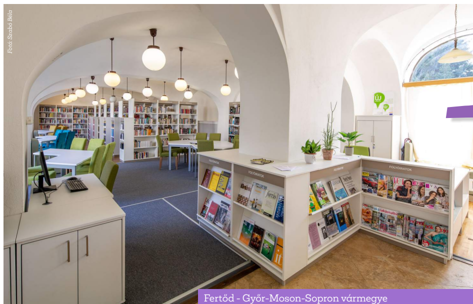
Fertőd - Győr-Moson-Sopron vármegye

2023-ban az országban több helyen is megemlékeztek a Könyvtárellátási Szolgáltató Rendszer (KSZR) elmúlt tíz évéről, gyakran hivatkozva az eseményre úgy, mint a KSZR 10 éves jubileumára. Valójában nem a rendszer, hanem annak jelenlegi formája volt 10 éves idén, hiszen 2013. január 1-jén lépett hatályba a jogszabály, amely meghatározta a kistételepülések könyvtári ellátásának aktuális kereteit. Az Informatikai és Könyvtári Szövetség, valamint a Hamvas Béla Pest Megyei Könyvtár szervezésében 2023. május 31-én Pócsmegyeren került sor a vármegyei hatókörű városi könyvtárak közös ünnepi szakmai napjára ugyanezen céllal, visszatekinteni a KSZR elmúlt 10 évére, annak eredményeire és a jövő lehetséges útjaira. Vajon hozott-e a 2013-ban hatályba lépő változtatás akkora újdonságot, hogy érdemes legyen ezt úgy kezelni, mint a KSZR „születésnapját”?