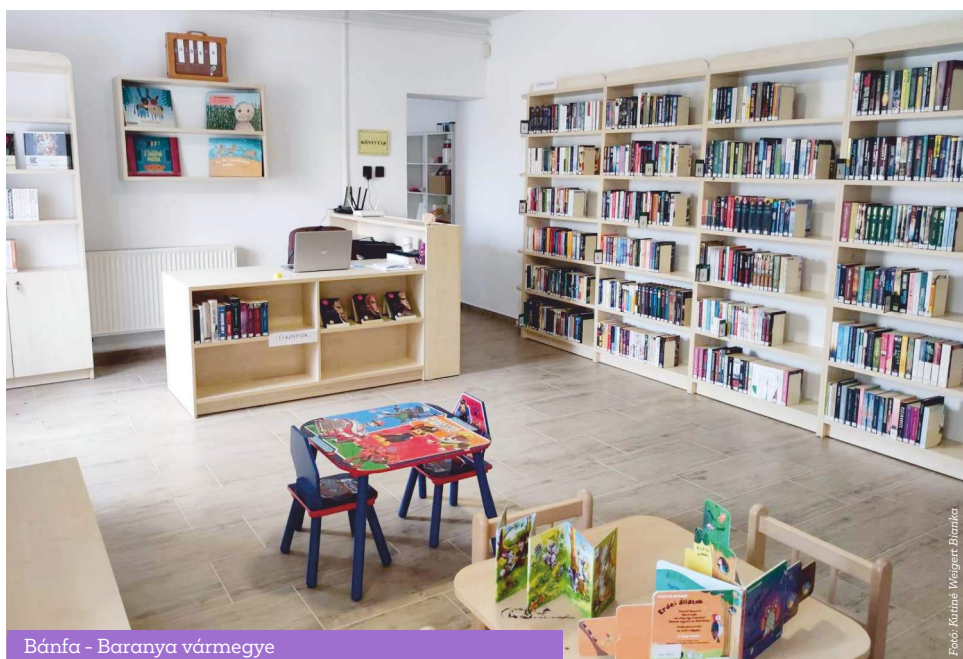
Bánfa - Baranya vármegye

„A legkisebb településeken élők információs esélyegyenlőségének biztosítása érdekében tehát szükség volt a könyvtárellátási szolgáltató rendszer új alapokra helyezésére”