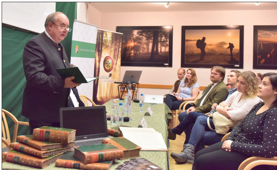
Zambó Péter, az Agrárminisztérium földügyekért felelős államtitkára, az Országos Erdészeti Egyesület elnöke köszönti a szakmai nap résztvevőit

A szakmai napon először Zambó Péter köszöntötte az egybegyűlteket. Felidézte, hogy az Országos Erdészeti Egyesület megalakulása óta zászlóvivője volt a magyar erdészeti szaknyelv és szakirodalom megteremtésének. Ehhez nem csak német-magyar erdészeti műszótárt alkotott már a 19. században, hanem folyamatos pályadíjkiírásokkal ösztönözte az alapvető magyar erdészeti szakmunkák megjelenését, aktívan támogatta azok kinyomtatását és terjesztését. Az 1862-ben Wagner Károly és Divald Adolf erdómérnökök, a hazai erdészeti tudományos közélet kibontakoztatói által útjára indított Erdészeti Lapok több mint 150 éve az egyesület ma is élő szakfolyóirata és egyesületi közlönye, hazánk egyik legrégebbi, folyamatosan megjelenő szakperiodikája. Nem véletlen, hogy a könyvtári állomány digitalizálása az Erdészeti Lapokkal és az Erdészettörténeti Közleményekkel kezdődött. Ezt a munkát, illetve a Wagner Károly Erdészeti Digitális Szakkönyvtár létrehozását az Agrárminisztérium, valamint annak jogelődje, a Földművelésügyi Minisztérium támogatta. Ezen projektek keretében mára közel 150 ezer oldal, mintegy 250 dokumentum digitalizálása történt meg.