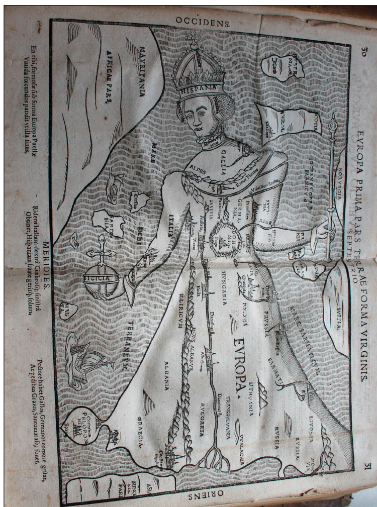
Europa Regina (Förrás: Bünting, Heinrich: Itinerarium Sacrae scripturae . Magdeburg, 1581.)

A tárlat centrális eleme az úgynevezett Europa Regina , vagy Európa királynő térkép, 5 amelynek részletei a tárlat plakátján, valamint kísérőanyagain is visszaköszönnek. Az öreg kontinenst Izabella császárné arcvonásait viselő női alakként mutatják be, ahol az Ibériai-félsziget a fej, a Német-római Birodalom adja a felsőtestet, Bohémia a szív, Közép- és Kelet-Európa országai a ruhát alkotják, Dánia és az olasz félsziget a karjait jelentik, Szicíliát pedig országalma formában a kezében tartja. Ismertek állat formájú térképek is: kiállításra került Famiani Strada De bello belgico (Róma, 1701) című kötete, amelynek a címlapján egy Leo Belgicus látható. Hollandia, Luxemburg, Belgium és Észak-Franciaország ülő oroszlán alakú ábrázolása vélhetően heraldikai eredetű.