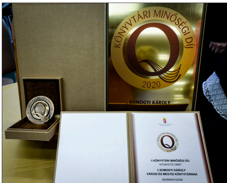
A Somogyi-könyvtár által elnyert Könyvtári Minőségi Díj

vékenységeinket. Ezért tartottuk indokoltnak a Könyvtári Minőségi Díjra kiírt pályázat elkészítését.