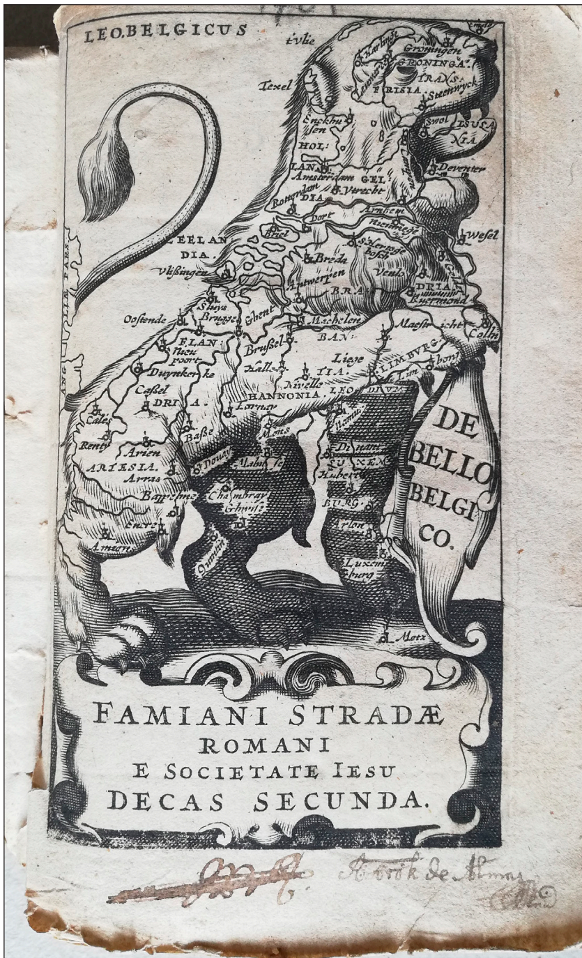
Leo Belgicus (Fornás: Strada, Famiani: De bello belgico. Róma, 1701.)