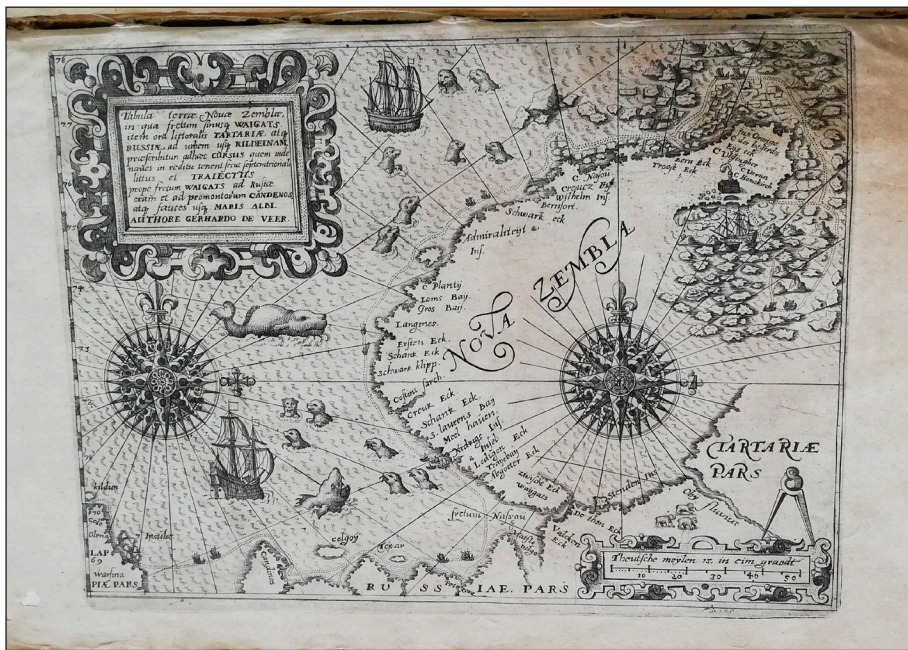
Willem Barentsz 1596-os expedíciója