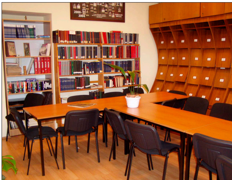
Kodály Könyvtár – kutatószoba

Hogyan lehetne jobban megfogalmazni a tudás, a műveltség, a szakmai követelmény szükségességét, mint ahogy Kodály tette, és mélyen hiszem, hogy mind-ebben a könyvtárnak, az oktató-képző intézmények szakkönyvtárának hatalmas felelőssége és kötelessége van.