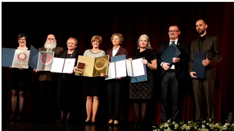
Csoportkép a díjátadóról

– Először is meg kell nézni, hogy mibe is vágunk bele; mik azok az alapelvek, amiket fontosnak tartunk és miket tettünk meg eddig ezek megvalósításáért. Próbálja megfogalmazni a könyvtár, hogy mik a legfontosabb céljai, és mit szeretne ezekkel elérni. Utána ehhez rendelje hozzá a módszereket, de leginkább kezdjen el széles körben sokszor beszélni a minőségről, a minőségfejlesztésről.