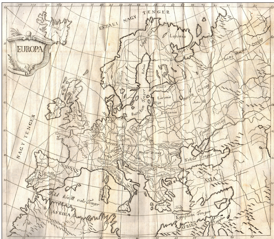
Magyar nyelvű Európa-térkép

fia történetének másik nagy erdélyi szereplője Bod Péter, 7 akinek az első magyar névrással ellátott világrész-ábrázolásokat köszönhetjük.