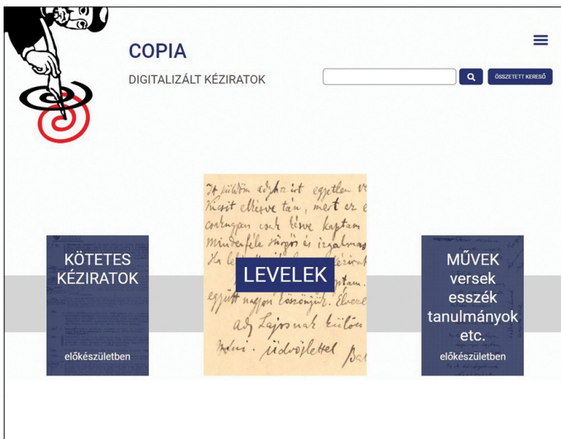
Az OSZK Kézírtatárának irodalomtörténeti forrásanyagait közlétező Copia kezdőoldala

magya is ambivalens érzésekkel hordozta ezt a családi kapcsolatot –, de mindenekelőtt az igazán nagy költő pályáját szolgálja, árnyékában mégsem lemondani a saját alkotói célokról.