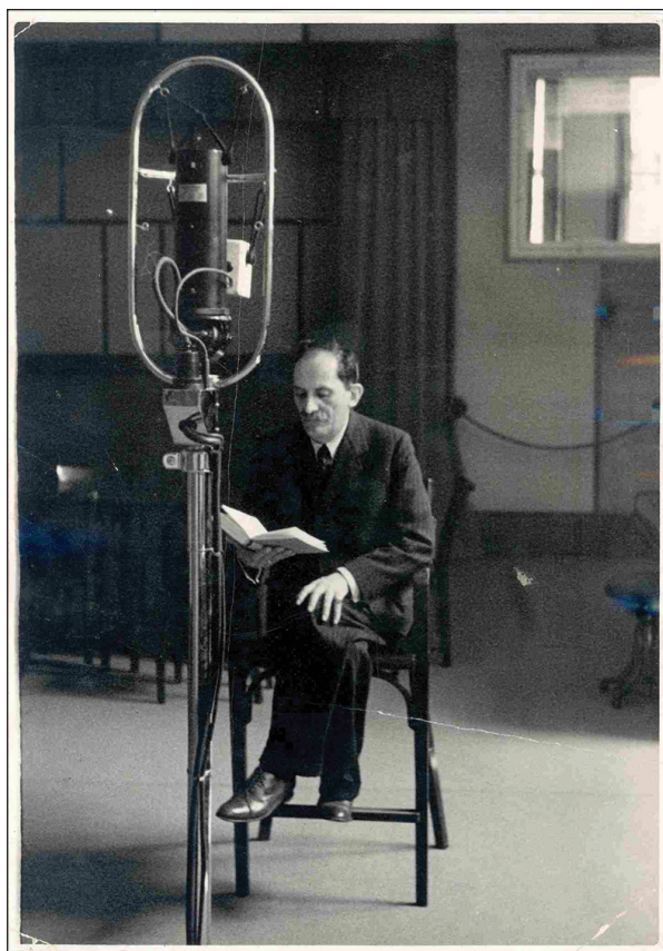
Babits Mihály felolvassa Esti kérdés című versét a Magyar Rádió stúdiójában, 1937.

keztében valóban páratlan dokumentumegyüttes keletkezett, mely nem csak protokolláris arcát őrizte meg a nagy költőnek, a Nyugat főszerkesztőjének, a Baumgarten Alapítvány kurátorának. (Úgy sejtjük, hogy a Babits iránti rajongás és elfogult tisztelet mellett a fényképalbumok létrejöttének háttérében ott állt kimondatlanul a sok szempontból törékeny valósággal szemben az ideális család képének megkonstruálása is, felmenőkkel, barátokkal, tisztelőkkel, gyermekkel, kutyával, itáliai utazásokkal, budai polgári-értelmiségi lakással, az esztergomi hegyen álló házzal, mely a remeteség és az irodalmi szalon sajátos elegyét nyújtja.)