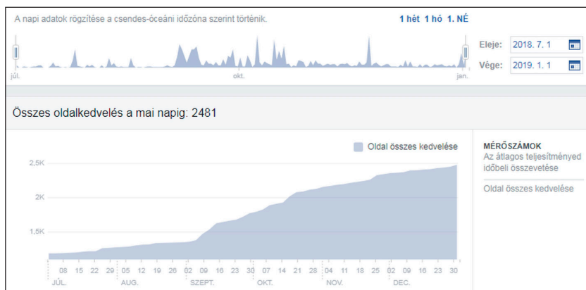
A Kultúrkinés Facebook-oldalt követők számának alakulása 2018 második felében

2018 második felében kísérleti jelleggel a Facebook-bejegyzéseinket különböző összegekkel és időtartamra kiemeltük, előrébb soroltuk. A kiemeléseknél lehetőség volt célzott beállításokra, például megadhattuk, hogy milyen életkorú felhasználók tartozzanak a kiemelt bejegyzések célcsoportjaiba, és milyen lokációval bírjanak. Továbbá megadtuk, hogy mekkora költségkerettel és hány napig legyen kiemelve az adott bejegyzés. Fizetni csak bankkártyával lehet, de lehetőség van forintban történő kiegyenlítésre is. A kiemelések menedzselésére és a számlák letöltésére a Facebook Hirdetéskezelőjében 21 van lehetőség. Az egyes posztokat a kiemelési lehetőségeket kihasználva nem csak a Facebook- ( mobileszköz-) hírfolyam -ban, de az Instagram-képfolyam -ban és az Instagram-story -ban is elhelyeztük, valamint a Messenger bejövő üzeneteiben található hirdetési funkciót is használtuk. Ahogy az alábbi diagramokon is látszik, a kiemeléseknek köszönhetően jelentős növekedésnek indult az oldalkedvelések száma, valamint a bejegyzésekhez köthető aktivitás (kedvelés, hozzászólás és egyéb műveletek) gyakorisága. Az átlagos elérések számából jól látszik, hogy a kép típusú bejegyzések több reagálást, hozzászólást és megosztást indukáltak, de a hivatkozás típusú megosztások esetében több kattintást ért el a bejegyzés.